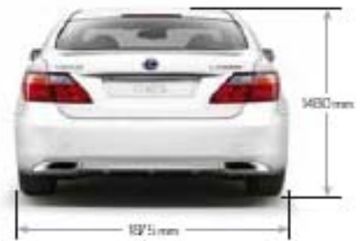
LS 600h L