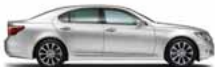
LS 460 / LS 460 AWD