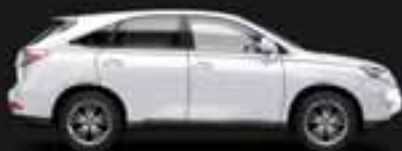
RX 450h Suv hibrid integral