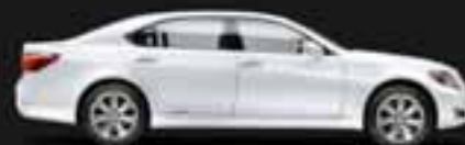
LS 600h / LS 600h L Limuzină de lux hibrid integral