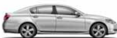
GS 300 / GS 460