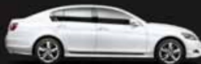
GS 450h Limuzină de clasă executive hibrid integral