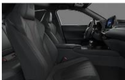
Piele mixta F Sport Black, plafon negru (LB21)