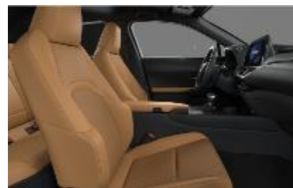
Piele mixta Hazel, plafon negru (LA42)