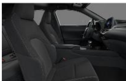
Stofa Black, plafon negru (FA20)