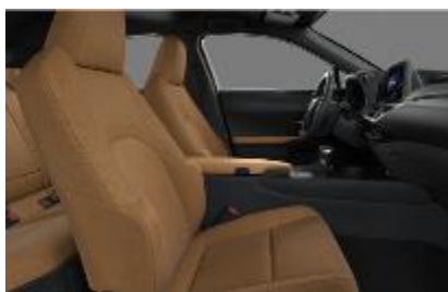
Stofa Hazel, plafon negru (FA42)