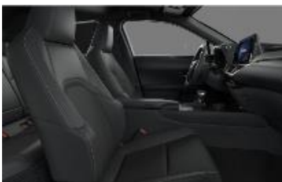
Piele mixta Black, plafon negru (LA20)