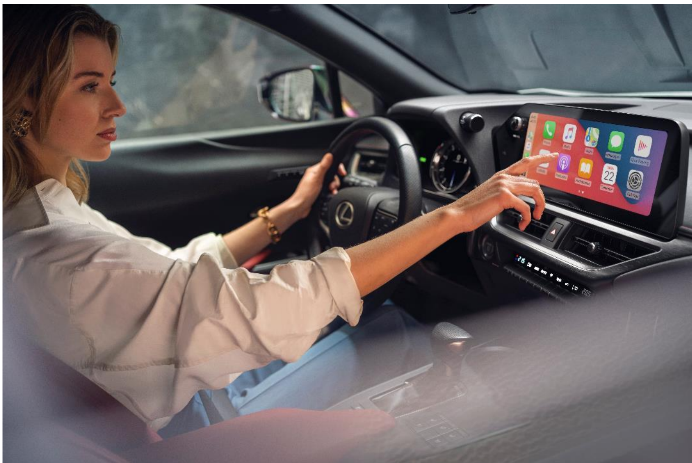
Imagine cu titlu de prezentare

*Preturi valabile in perioada 04 – 31 Martie 2023