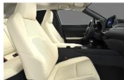
Piele mixta Rich Cream, plafon alb (LA00)