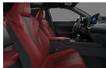
Piele mixta F Sport Flare Red, plafon negru (LB31)