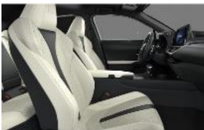
Piele mixta F Sport White, plafon negru (LB01)