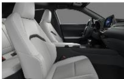
Piele mixta White Ash, plafon negru (LA10)